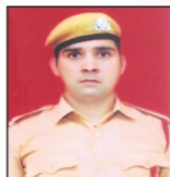
PARDEEP L & T Ltd.