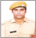
LOKESH L & T Ltd.