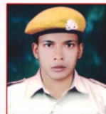
OMPRAKASH BHAJIPALE LLOYD Insulation Ltd.