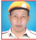
MANZIL DEBBARRAMA ONGC