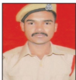
UPHADE AKASH DILIP DNH Spinners Ltd