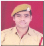
ANKUSH JTPL Ltd