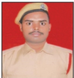
MOHAMMAD ALI JTPL Ltd