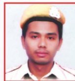
DWIPEN BRAMHA L & T LTD.