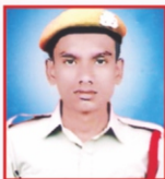
VINAY NOGOSE L & T LTD.