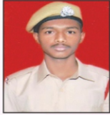
TESHIT N. BAGADE L & T Ltd.