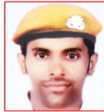
RYAN CURIA Shipping Corporation