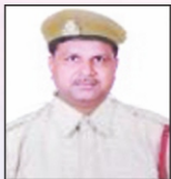
RAVAL BHAI Sainik Asptal