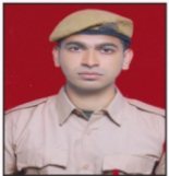
ANANDU V DNH Spinners Ltd