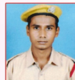
DIPANSHU Amkantak Thermal Power