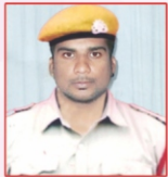
RAHUL Petron Ltd.