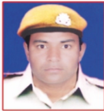
DINESH RAMKARAN Thermal Power Station