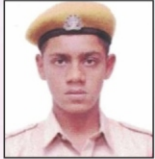
AMAAN ALI L & T Ltd.