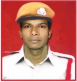
MAHINDRA BABRIYO Petron Ltd.