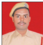
MOHAMMAD ALI L & T Ltd.