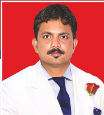
Meet To Honorary President of NAFS www.facebook.com/SUSHANTKUMARNAFS