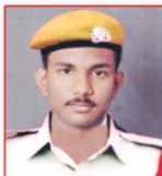
R RAHUL Fortification Pvt Ltd.