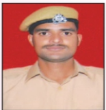
RAJ KUMAR JTPL Ltd