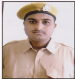
ERESH MANIK KOLI NTPC