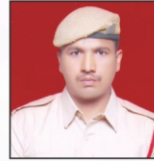
AJAY L & T Ltd.