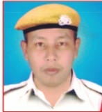
MANZIL DEBARMA Oil and Natural Gas Corp. Ltd.