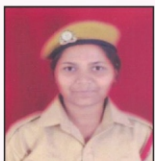
SUSHMITA LATA JTPL Ltd