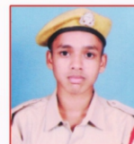
SUGAT Amarkantak Thermal Power