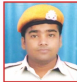
PRAVIN GAJENDRA L & T LTD.