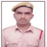
SANSKAR JTPL Ltd