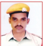
AASHIQ ANSARI L & T LTD.