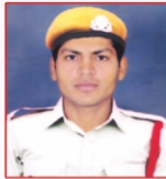
BALINDER SINGH Thermal Power Station