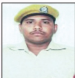
NIMBOKAR UDAY L & T Ltd.