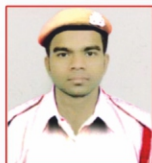
AKHILESH KUMAR Construction Company Ltd.